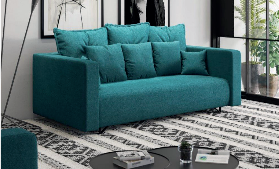
SOFA 3-OS ASAMI SOBA